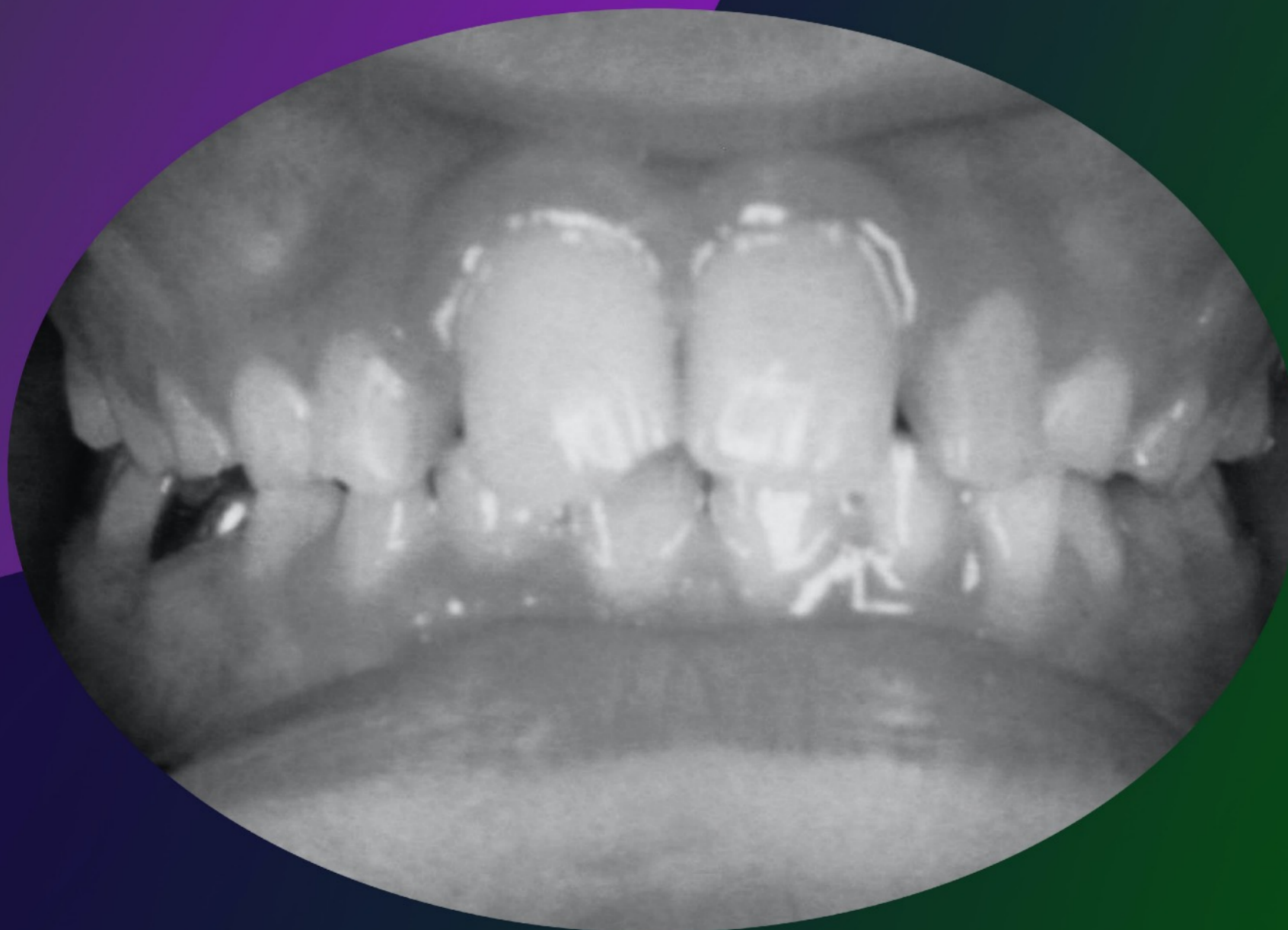
Paciente DI -10 anos